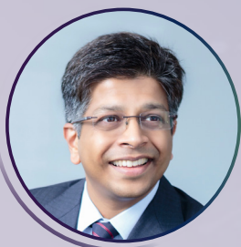
Microsoft Asia, Regional Business Lead, Manufacturing